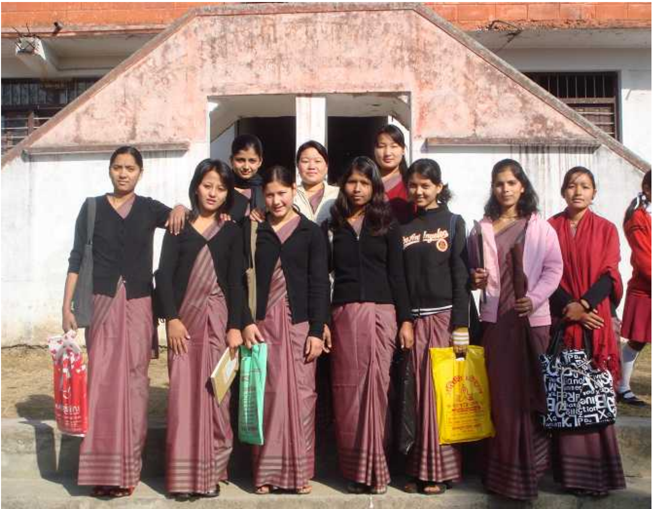
卒業生全員の記念撮影（キャンパス前にて）

一人の先生になる私が教育というものを説明すると、本当に教育とは国家の発展の重要な基本です。国のバックボーンです。そして知識発展のための第一歩です。教育によって人間は自分の家族、国家の為に役立つことができます。私は一人の小学校の先生がするように小さな芽のような子供達に肥料を与え、かわいがって花や実をつけさせる、そうした良い国民を作らなければならないと希求しています。